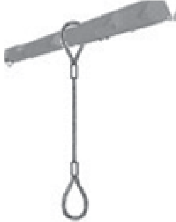
Appendimento singolo verticale